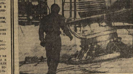
Скоро на экраны выйдет кинофильм «Венера-9» и «Венера-10». Кадр из кинофильма «Венера-9» и «Венера-10» с космическим аппаратом после зачетных комплексных испытаний.