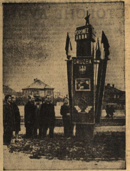
Труженики Аннинского района и жители Знойма связывают тесные узы дружбы. Чехословацкие и советские товарищи часто бывают в гостях друг у друга. НА СНИМКЕ: советские гости у монумента Дружбы в Зноyme.

ХРОНИКА Пленумы райкомов КПЧ В шести районах Южной Моравии состоялись пленумы райкомов КПЧ. На них шла речь о том, как повысить эффективность сельхозхозяйственного производства, отмениться, что и в дальнейшем труженикам полей и ферм надо идти по пути кооперирования и специализации сельского хозяйства. В работе пленумов приняла участие ответственное сотрудничество министерства земледелия и продовольствия ЧССР, Южно-Моравского округа партии. Во время месячника еще шире становится социалистическое соревнование за успешное завершение плана пятой пятилетки. Сейчас многие члены союза чехословацко-советской дружбы берут новые, повышенные обязательства, стремятся достойным трудом отметить приближающийся XV съезд КПЧ. С особым подъемом трудятся в дни месячника коллективы, выполняющие заказы для Советского Союза. Нет сомнения в том, что месячник дружбы поможет двум братским народам, идущим по пути, указанным великим Лениным, еще лучше узнать друг друга.