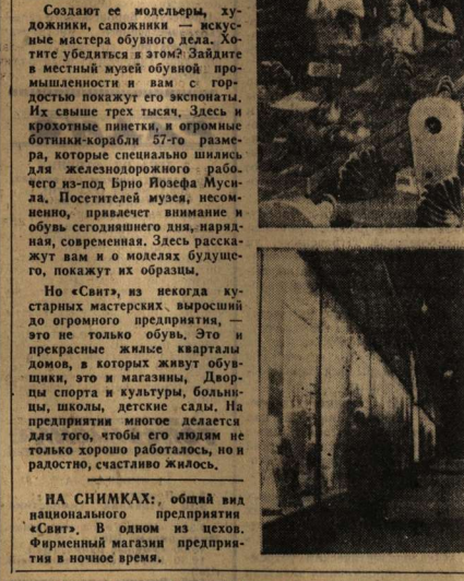
НА СНИМКАХ: общий вид национального предприятия «Свит» в одно из цехов. Фирменный магазин предприятия в ночное время.

К месячнику чехословацко-советской дружбы магазины «Советская книга» на предприятиях и в учебных заведениях Брно подготовили около 500 экземпляров произведений советских авторов. В магазинах большой выбор политической, художественной, научной и детской литературы. Труженики полей Южной Моравии закончили уборку сахарной свеклы на 43 765 гектарах. Лучших результатов в областном соревновании добились свекловодцы единого сельскохозяйственного кооператива в Янаковице-на-Гане.