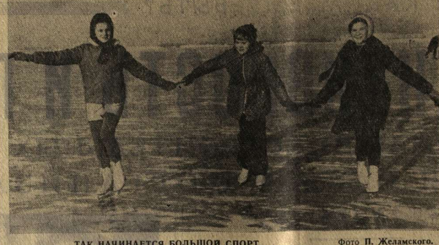
ТАК НАЧИНАЕТСЯ БОЛЬШОЙ СПОРТ.

Адрес редакции: 394746, ГСП, г. Воронеж, центр, проспект Революции, 5-34-52, сельхозиздательство-5-24-80, 5-43-57, советского строительства и быта-5-46-29, писем и раскльоров-5-44-32, 5-34-78, информации-5-14-77, 5-38-15, объявлений-5-25-21, выпускающих-5-26-45.