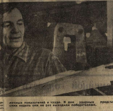
во, расширяют ассортимент.