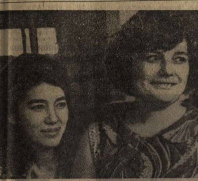
вещал. Они систематически перевыполняют сменные задания, досрочно завершили личные пятилетки.