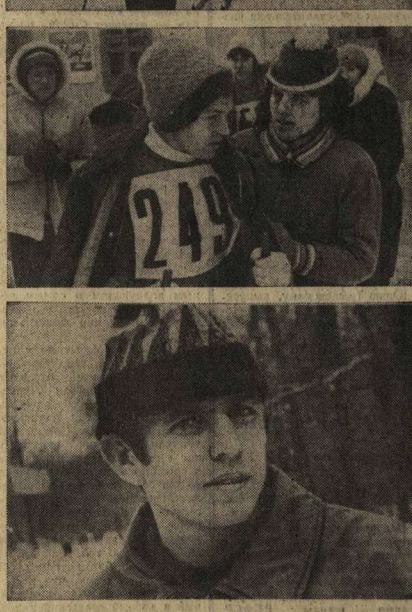
ПРИВЕ. Фигуристка Елена Водорезова.