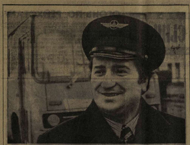
Старейшему в Воронеже пассажирскому автотранспортному предприятию № 4 исполнилось 50 лет. Начав свою деятельность с автобусов марки «Фольксваген», оно выросло в мощное современное транспортное хозяйство. Теперь в хозяйстве имеется 300 комфортабельных машин.

Для участников семинара была организована выставка «Из опыта использования технических средств обучения в школах г. Воронежа» и показаны кинофильмы «Учебные кабинеты в школе».