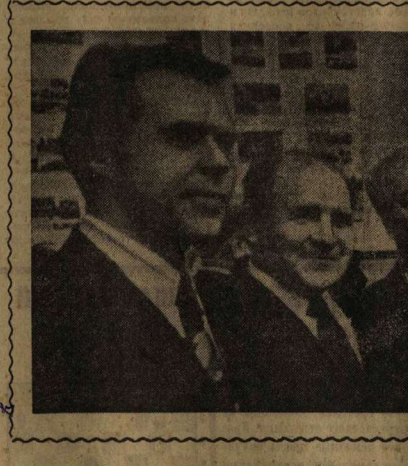
Многие еще нужно сделать вашей администрации в создании нормальных условий труда и быта рабочих, обеспечении жилищным и бытовым, учебно-спортивным. Партийным организациям стоит поворачивать лицом к этой проблеме.

К сожалению, облисполком, Воронежский и Борисовский горисполкомы, некоторые райисполкомы не проявляют пока должной активности в этом деле. Из-за чего, например, в колхозах области в прошлом году на непроизводственные строительство направлено всего лишь 37 процентов от общего объема капитальных вложений, в несколько раз меньше, чем в годы восьмой пятилетки. Подобное положение создалось и на ряде промышленных предприятий. Так, не имеют учреждений культуры предприятия радиотехнической, легкой, пищевой, промышленности, строительные организации. Ни одно предприятие Министерства электротехнической промышленности не имеет