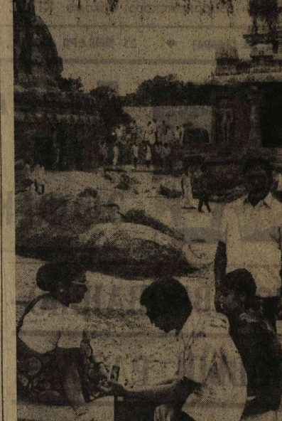
В МАХАБАЛИПУРАМЕ, небольшом прибрежном местечке близ Мадраса, столицы штата Тамилнад, сооружаются древнейшие памятники архитектуры Индии: крупнейшая в мире наскальная барельеф, храмы, высеянные на гранитных монолитах. Все эти шедевры были созданы в VII-VIII веках. НА СИМЛИКЕ: древние храмы в Махабалипураме.

Руководитель МАНУ сказал, что борьба против национальной революции в Чили как период активной борьбы коммунистов, которая разоблачает реакционную политику режима Пиночета. Руководитель МАНУ сказал, что борьба против национальной революции в Чили как период активной борьбы коммунистов, которая разоблачает реакционную политику режима Пиночета.