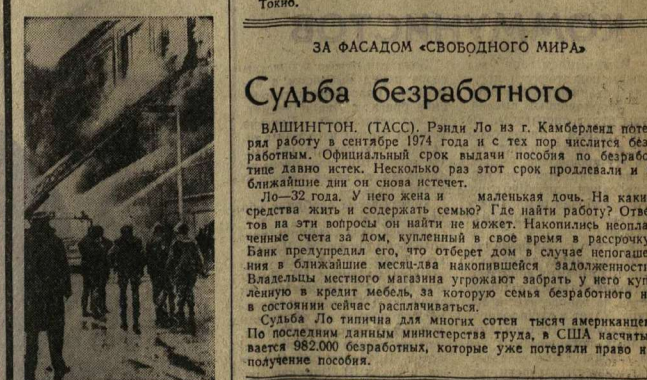
Еще одна бомба взорвалась в Белфасте. На этот раз она была брошена в здание одного из магазинов торгового центра. Принес значительный материальный ущерб. НА СНИМКЕ: на месте пожара, вызванного взрывом зажигательной бомбы.

Успешно развивается сотрудничество тунисской авиалинии с советским «Аэрофлотом», самолеты которого совершают ежедневные рейсы в тунисскую столицу. (ТАСС).