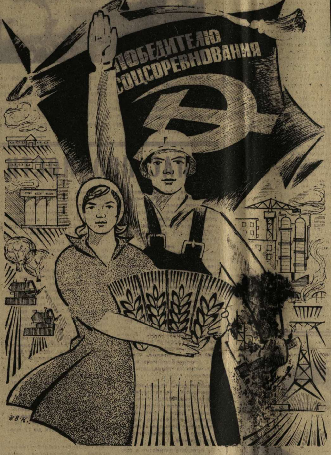
Рисунок Н. ВАСИЛЕНКО.

В поддержку инициативы Кировцев: «Пятилетку казенно» — работу гарантийной бригады цеха № 2 возглавлял коммунистом И. С. Солиным. Этот коллектив в технологическом потоке тесно связан с бригадами слесарей из других цехов завода. Их совместный договор за качество выпускаемой продукции нашей многочисленных последователей. В. ЗАК, инженер завода «Воднашборудования».