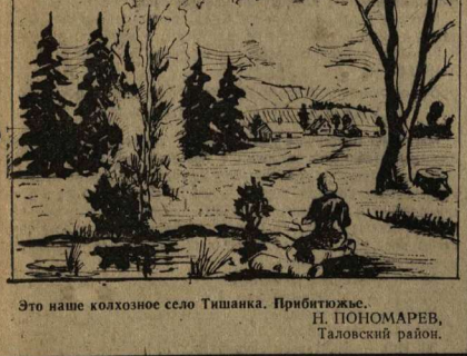
Это наше колхозное село Тишанка. Прибытжю. Н. ПОНОМАРЕВ, Таловский район.