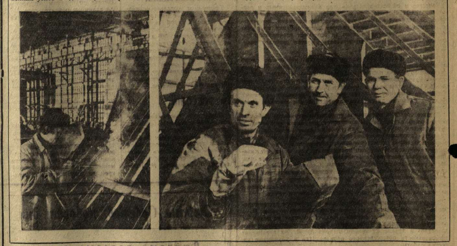
Суда для Волго-Дона