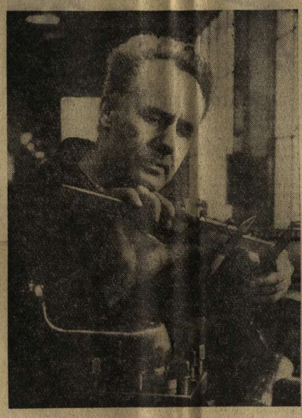
бу за рачительное, умелое хозяйствование. Много лет я работаю в колхозе имени Енгельса Ревельского района. Хозяйство наше большое, экономически крепкое. Оно с основным специализируется на производстве молока. Можно с полным правом сказать, что по надоям молока от фуражных коров мы колхоз занимаем одно из первых мест в районе. За время предсезонного социалистического соревнования животноводы колхоза на 75 процентов выполнили квартальный план продажи молока государству. Никому не секрет, что условия минувшего года сложились крайне неудовлетворительными для села. Очень туго с кормами. И вот при таких ограниченных возможностях не снижать надоев молока — дело простое. Успех главным образом объясняется тем, что все животноводы прини-