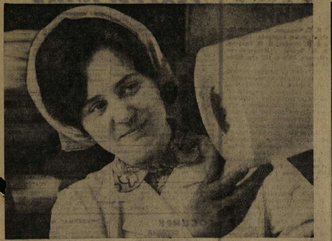
На торномском заводе «Пластмасс» шесть участников, 13 см и 14 бригад соревнуются в этом году под девизом: «Пятилетке — рабочую гарантию».

Уже в первом году десятой пятилетки трудящиеся предприятия дополнительно к плану реализовали своей продукции на 15 тысяч рублей.