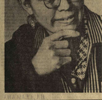
В КРАСНОЗНАМЕННОМ КОЛЛЕКТИВЕ