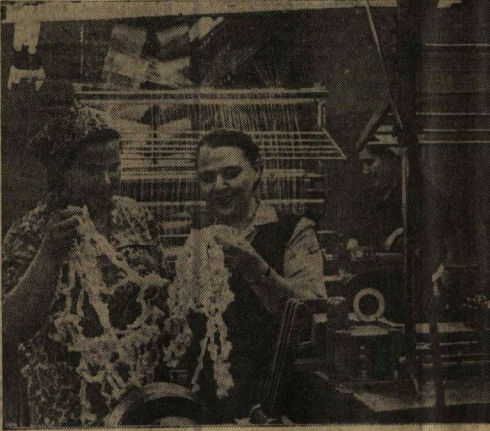
В ФАНОВОМ пехе производственного объединения «Трикожа» соревнуются между собой передовики производства.