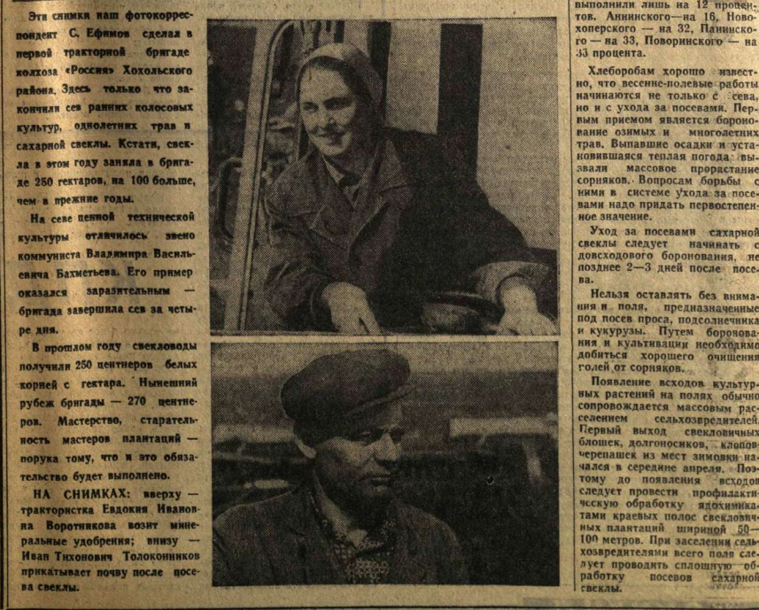
(Опубликовано на 3-й стр.)

Выдающийся организаторские способности и полководческий талант Андрея Антоновича, подчеркнул Д. Ф. Устинов, особенно ярко раскрылись в суровые годы Великой Отечественной войны. Его деятельное участие в освобождении Кавказа за освобождение Украины, подчеркнул Д. Ф. Устинов, особенно ярко раскрылись в суровые годы Великой Отечественной войны. Его деятельное участие в освобождении Кавказа за освобождение Украины, подчеркнул Д. Ф. Устинов, особенно ярко раскрылись в суровые годы Великой Отечественной войны. Маршал Гречко умело и твердо проводил в жизнь линию партии по обеспечению благоприятных условий для социалистического труда советского народа, упрочению позиций социализма, мира и безопасности народов. Все свое огромные знания, энергию, обширные знания, боевой боевой опыт и талант