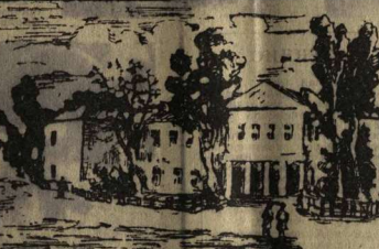
Рисунок И. Г. Пономарева из Старой Тиханки Таловского района.

Только за четыре месяца нынешнего года почтальоны доставили нам почти 12 тысяч писем. Из них четыре тысячи девести опубликованы.