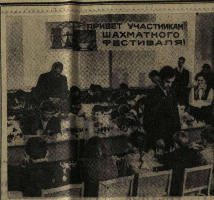
ПРИВЕТ УЧАСТНИКАМ ШАХМАТНОГО ФЕСТИВАЛЯ!