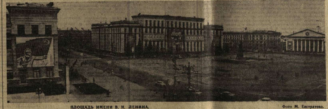
ПЛОЩАДЬ ИМЕНИ В. И. ЛЕНИНА.