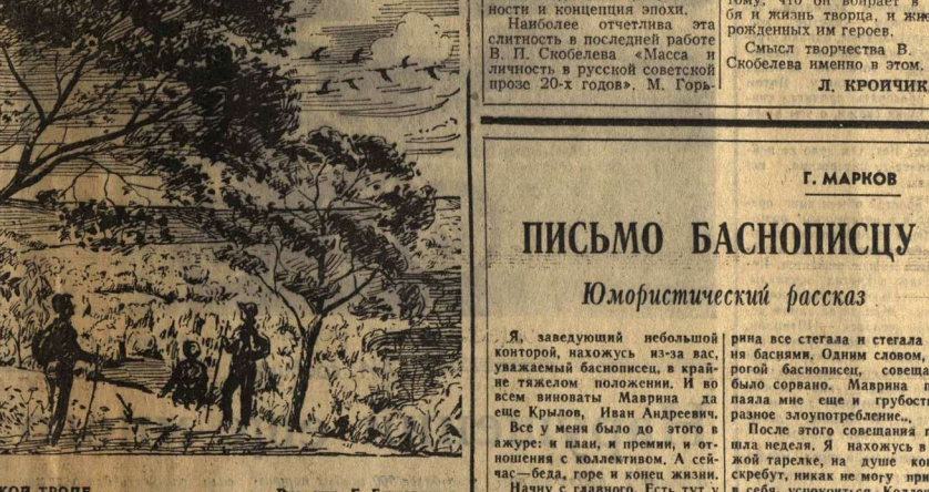
Рис. худ. Г. Гогорова.