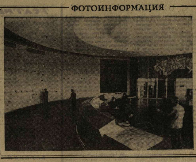
ФОТОИНФОРМАЦИЯ С КАЖДЫМ годом растет значение школы в жизни нашей страны. В связи с этим повышается необходимость создания в Москве нового пункта для более оперативного руководства энергетикой, для быстрой обработки поступающей информации и распределения электроэнергии. И вот такой центр вступил в строй. Он размещен в огромном зале площадью более 400 квадратных метров, здесь установлена новейшая аппаратура, изготовленная на Ленинградском заводе «Электронлест».

Решено получить в нынешнем году с гектара по 24 центнера зерна, 220 центнера сахарной свеклы, 16 подсолнечника. Будет введена в эксплуатацию новая восьмилетняя школа в Александровке, возобновлено строительство центральной районной больницы.