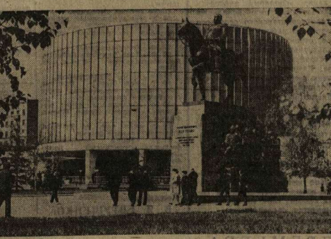
Москва сегодня. У лупы — панорама «Бородинская битва».

успехам тружеников заводов и полей района. На выставке широко представлены рисунки пионеров и школьников Бланско. Здесь можно увидеть материалы о дружбе рабочих заводов «Адмет» — предприятия имени Чеховско-советской дружбы в А. Адмет — и Борисоглебского ордена Трудового Красного Знамени завода «Химмаш», фотоальбомы, присланные коллективами школ из Влеса Опатовиче и Лисиче. Отдел пропаганды и агитации Борисоглебского гор-