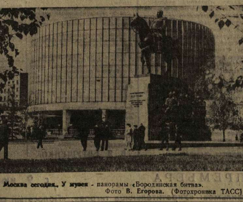
Москва сегодня. У лупы — панорама «Бородинская битва».

Живой интерес в Борисоглебском педагогическом институте вызвала выставка, присланная из города-побратима Бланско. Она состоит из трех разделов. Первый из них — «Они пахли в бою на поле чести и славы» — рассказывает о подвиге советских воинов-освободителей. Другие экспозиции посвящены тридцатилетью социалистического строительства в СССР.