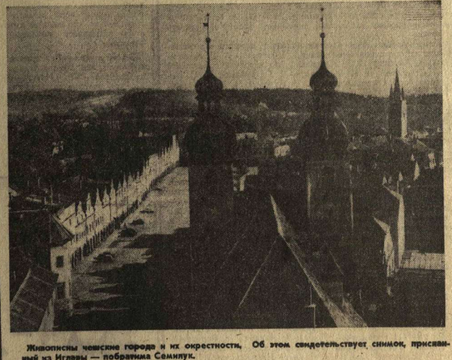
Живописная чешская городская и ее окрестности. Об этом свидетельствует символ, присвоенный из Иглавы — побратимам Семилукам.

С хорошими показателями выполняли первые полугодичные задания сельского хозяйства Южной Моравии. Они вступили с опережением графика по производству основных видов продукции животноводства: говядины — на 103,6 процента, свинины — на 101,5. Сверх плана госхозами и едиными сельскохозяйственными кооперативами произведено пять миллионов килограммов молока. В числе правопреемных двух коллективов хозяйств районов Голонин, Трибач, Брно и Брно-венков. В производственном высшем звене руководителей хозяйств района Жакр-на-Сазава и Брно-венков — побратимы Грибановки и Рамина. А. НОВА.