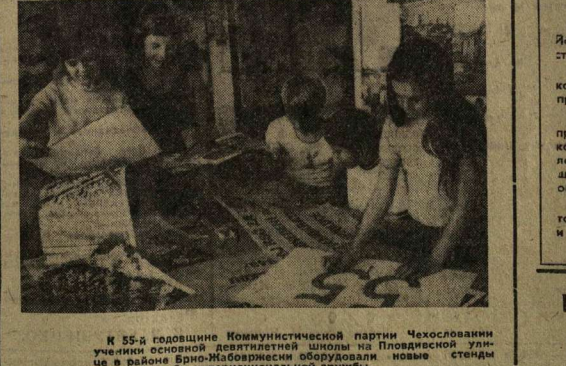
К 55-й годовщине Коммунистической партии Чехословакии ученики основной десятилетней школы на Плаванинской улице в районе Брно-Жабовицкие оборудовали новые стелды в своем клубе интернациональной дружбы.