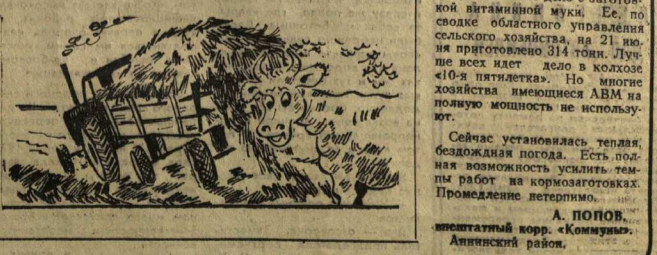
Сейчас установилась теплая, бездождная погода. Есть полная возможность усилить темпы работ на кормозаготовках. Промедление летерно. А. ПОПОВ, внештатный корр. «Коммуны», Аннинский район.

Годовая потребность колхоза и совхоза Аннинского района в сенаже определена в 36,7 тысячи тонн. Решено заготовить этого ценного корма 43,5 тысячи тонн. На 1800 тонн больше годовой потребности наметено заготовить витаминной муки. Заготовка кормов способствует все: мощный тракторный парк, обилие сенокосов и сенокосных угодий, развитая техника и транспорт. Для приготовления витаминной муки район имеет двенадцать АМ. Отлично идет заготовка сенажа в колхозе имени Кирова. Последние два дня здесь укладывают в траншеи по 300 тонн сенажа. Столь же организованно идет приготовление ценного корма и в колхозе 450 лет Октября. Здесь полевые операторы приняты обязательства по заготовке грубых и сочных кормов. Для общественно-животноводства они решили заготовить вместо 96 тонн сенажа 1300. Поруча этому — ударный труд кормодобывателей. Замечательно работает коллектив механизированного отряда, возглавляемого В. В. Тарасовым. За рабочий день они укладывают в траншею по 100 и больше тонн зеленой массы. Первенство в соревновании удерживают комбайнеры В. Ф. Маденин и И. Д. Шелякин. За смену они выполняют норму на 120 процентов. Полугодичный запас грубых и сочных кормов решено