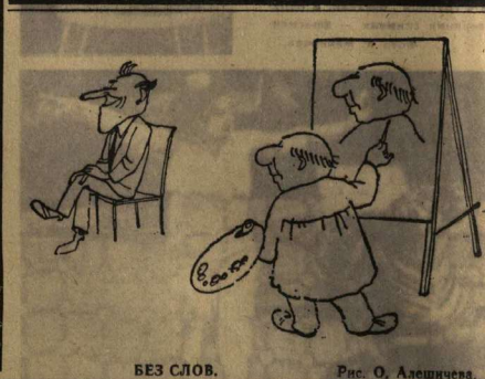
БЕЗ СЛОВ. Рис. О. Алешинцева.

Неделю в доме девочка чужая, была ведь на два дня приглашена, Вдурю загостилась — вот тебе и на! Теперь жавка, пока всех линия, На первый взгляд как будто не мешая, Неволю нарушает все она... Но разве в этом лишь ее вина? Быть осторожной надо, приглашая, Она вам показала, по пыски, Удобрее, взрослее и умнее. Жалесте, что жизнь — это такая с нею? А может, нет? Ей-богу, Она смеется, девочка чужая, Она прощенья просит, уезжая, Уносит в спешке не свои перчатки, Дверь хлопнула — ну, все теперь в порядке, Но на столе на вашем — страннй ряд, Из проволок зерен там стоят. Вызванные на свет ее рукою, Вас прежним заражаю непокоем, Вот любимая книга в руках, Но открой — одолеет васозота, Что же нравилось в этих строках? А ведь все-таки нравилось что-то... Здесь закладка лежит меж страниц, Здесь пометки нестраши, на страницах, Это чувство утрате сродни, Что еще может с этим сравниться? Так в холодный Искристый инг Там в печальном открытмй прихлдит, Смотрить в лица людей И любия к ним в себе не находила, Но разгадка, как солнече слеза, Все сомненья отбросила смею: Это все стало простору частью тебя, Растворялось в душе до предела.