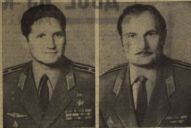
Командир экипажа космического корабля «Союз-21» летчик-космонавт СССР, Герой Советского Союза полковник Борис Валентинович Вольнов.