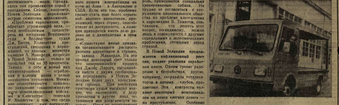
НРБ. Новая модель электрооблава создана в Софийском институте электроаппаратов и моторов. Она проходит сейчас испытания на улицах болгарской столицы.

На основе этой модели будут строиться электрооблава грузоподъемностью в одну, полторы, две и две с половиной тонны, предназначенные для коммунально-бытового обслуживания. С. ЗИМИН, сов. корр. АПН. Велдинтон.