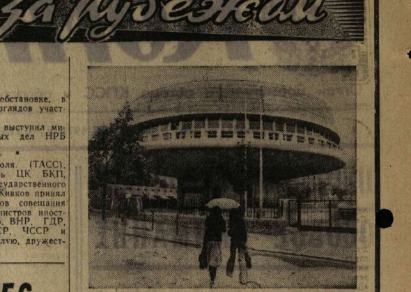
Более тысячи абонентов будет обслуживать новая телефонная станция, строительство которой ведется на улице Мира в Париже. Построение из бетона в форме огромного гриба, здание вступит в строй в будущем году.

София, 22 июля. (ТАСС). 21—22 июля в Софии состоялось совещание заместителей министров иностранных дел, в котором приняли участие представители НРБ, ВНР, ГДР, ПНР, СРР, СССР, ЧССР, Югославии и Польши.