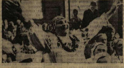
Реплика из зала.