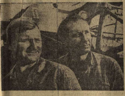
С ОВХОЗ «Пионер» Новоусманского района активно включился в сборку урожая...