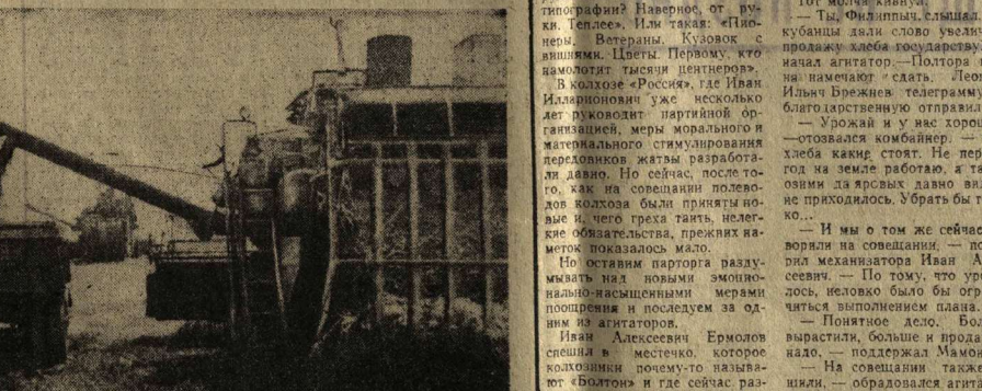
В колхозе «Россия» уборка урожая комбайнерами.