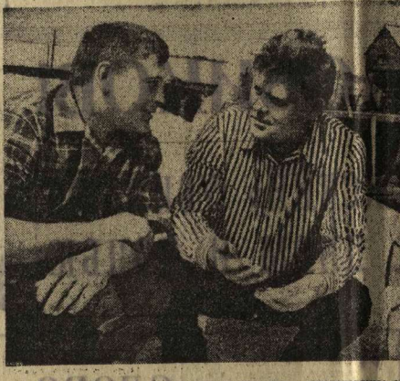
Активно работает в эти дни группа народного контроля в колхозе «Победа» Верхнехвалского района. В составе дозорных коммунистов, комсомольцев и беспартийных, люди разных специальностей и возрастов, но цель у всех одна — любым участием содействовать успешному проведению уборочных работ без потерь зерна. Народные контролеры дежурят на полях, осуществляют постоянное наблюдение за очисткой и сушкой зерна, отработкой его государству, проверяют работу автотранспорта. Члены группы следят за тем, чтобы комбайны и жатки использовались как можно поглубже и быстрее, не допускались простои техники и механизмов. В колхозе созданы и работают уборочно-транспортные отряды, зерна, с учетом этого и раставлены бригады активистов народного контроля и членов группы, на один участок уборочного комплекса не осталось поле зрелой пшеницы. На полях стеблей, на току и в направлении колхоза выпускаются листья заводского контроля, особые случаи брака работы для улучшения не остаются незамеченными, передаются широкой гласности. На снимке: народные контролеры колхоза (слева направо) шофер Иван Алексеевич Рапов, агроном-семеновод, заместитель председателя группы народного контроля Николай Семелович Тобина и шофер Иван Емельянович Дура.