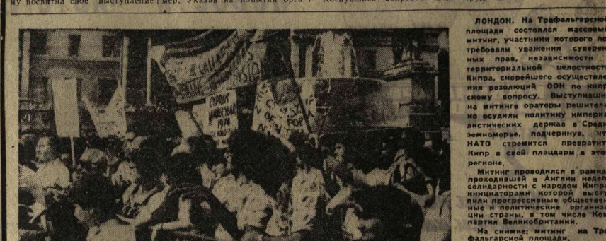
На снимке: митинг на Трафалгурской площади. Шангенва.

Вопросам трудовых отношений. Правительство заявило, что оно должно защищать революционные завоевания трудящихся.