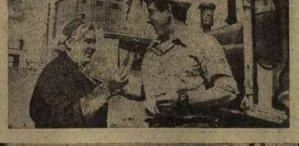
Много дел у весовщиков и взвешивателей элеватора, не менее загружены те, кто обеспечивает бесперебойную работу механизмов по сушке и переработке зерна. Коллектив элеватора по примеру работников Калачевского хлебоприемного пункта, перед началом уборки определил свои новые рубежи, дал слово обеспечить четкий прием хлеба.