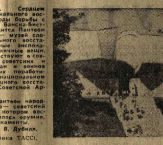
Со всех континентов