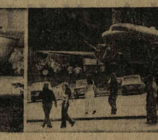
Со всех континентов