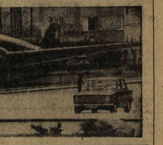
Со всех континентов