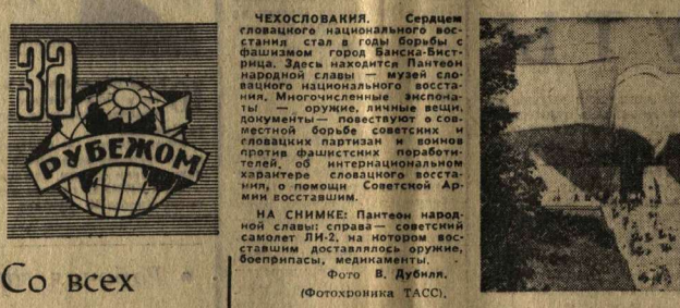
Со всех континентов

Вот почему так важно, чтобы обязательства были конкретными, измеримыми, проверяемыми. Они должны быть не просто «для галочки», а реальными обязательствами, которые человек берет на себя добровольно и с ответственностью. Только так можно добиться высоких результатов в социалистическом соревновании.