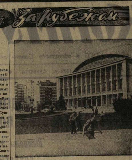
РУМЫНИЯ. Бухарест. Площадь Дворца Республики. (Фотохроника ТАСС).