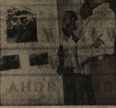
В СТОЛИЦЕ Голландской Республики Лозе открыта выставка советской фотографии. Представленные на ней работы известных мастеров рассказывают об истории и географии дн СССР, об успехах советского народа во всех областях экономической и культурной жизни.