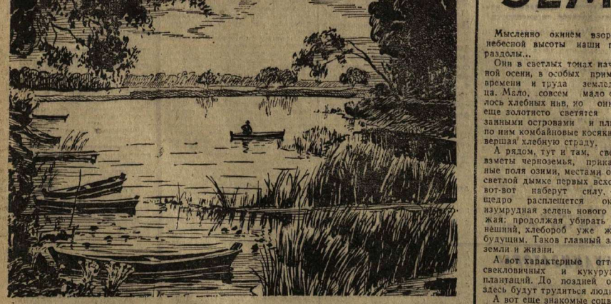
ТИХАЯ ЗАВОДЬ. Рис. Г. Гончарова.