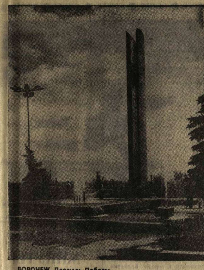
ВОРОНЕЖ. Площадь Победы.