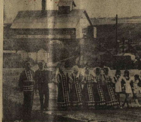
Коллектив художественной самодеятельности колхоза «Глиный Дон» Острогожского района работает на колхозном току.