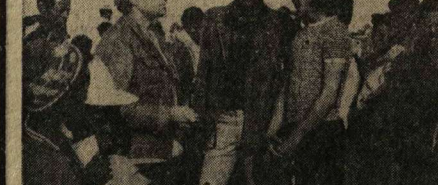
На востоке Африки лежит древнейшее государство континента — Эфиопия. Его территория — 1184 квадратных километра.

социалистического сотрудничества с целью положить конец гонке вооружений и дополнить политическую разрядку напряженности разрядкой военной. Немецкий союз мира подчеркивает, что именно Советский Союз и другие государства — участники Варшавского договора внесли предложения, позволяющие сделать первые шаги к разоружению, не нарушая военного равновесия в Европе.