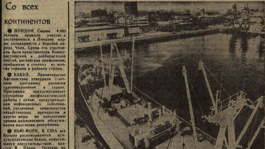
До работы народом власти Кубы вынуждена была закупать рыбу в других странах. Сейчас национальный промысловый флот Кубы, оснащенный современной советской техникой и судами, — один из крупнейших в Латинской Америке, а построенный при содействии Советского Союза специализированный рыболовный порт с новейшим оборудованием вообще не имеет себе равных в странах Латинской Америки. Страна располагает также консервными заводами, портовыми холодильниками, фермами для ремонта океанских и постройки каботажных судов.