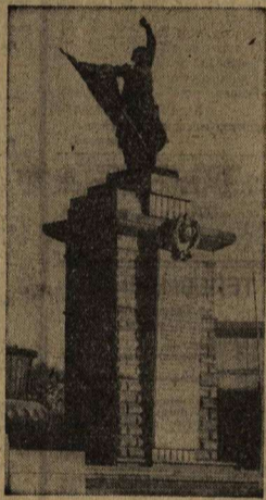
Памятник советским воинам-освободителям на площади Красной Армии в Брно.