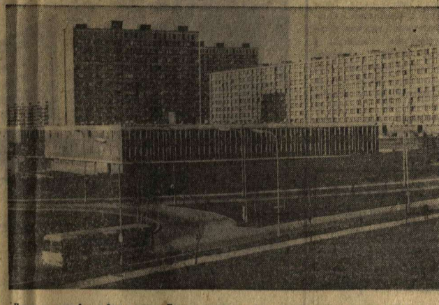
Леса — новый район города Брно, в котором сейчас живут шесть тысяч человек.