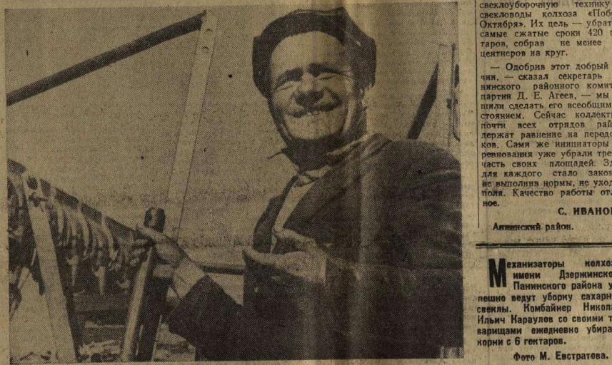
• Под острым углом

специалистов транспортных организаций и других работников. Основная задача проверки — оказать действенную помощь партийным и советским органам, колхозам, совхозам и сахарным заводам в обеспечении высокопроизводительного использования автотранспорта на вывозе сахарной свеклы, устранение и предотвращение недостатков в его работе. Постановлением рекомендовано результаты проверки систематически обсуждать на заседаниях комитетов народного контроля и бюро райкомов ВЛКСМ, вносить предложения на рассмотрение правлений колхозов, руководителей совхозов, партийных и советских органов, освещать в районных и областных газетах, по телевидению и радио.