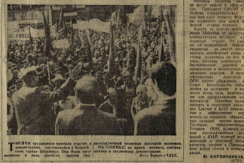
ТЫСЯЧИ трудящихся приняли участие в демонстрации, состоявшейся в бельгийском городе Шарлеруа. Она была организована в знак протеста против пр...

С. ЗИМНИН, гос. корр. АПН, Веллингтон—Сидней.