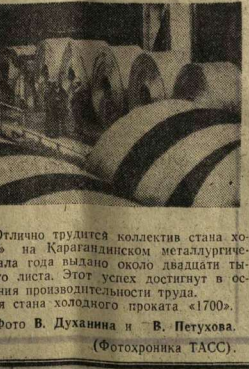
КАЗАХСКАЯ ССР. Отлично трудятся коллектив стана холодного проката «1700» на Карагандинском металлургическом комбинате. С начала года выдано около двадцати тысяч тонн сверхпланового листа. Этот успех достигнут в основном за счет повышения производительности проката «1700». На снимке: продукция стана холодного проката «1700».

Большое внимание уделяется художественному оформлению станций, вышек, мостов. Здесь используются мрамор и гранит, добываемые из месторождений Узбекистана. Это желто-розовый газганский мрамор и белый мурашкинский. Пол выкладывается черно-серым лабрадоритом. Стены штукатурят не только мрамором республики.