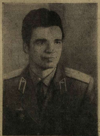
Командир корабля подполковник Зудов Вячеслав Дмитриевич

14 октября 1976 года в 20 часов 40 минут московского времени в Советском Союзе осуществлен запуск космического корабля «Союз-23», пилотируемого экипажем в составе командира корабля подполковника Зудова Вячеслава Дмитриевича и бортинженера подполковника-инженера Рождественского Валерия Ильича. Целью запуска корабля «Союз-23» является продолжение научно-технических исследований и экспериментов с орбитальной научной станцией «Салют-5», начавших 7 июля 1976 года при совместном полете транспортного корабля «Союз-21» и станции «Салют-5». Бортовые системы корабля «Союз-23» работают нормально, самочувствие экипажа хорошее. Космонавты товарищи Зудов В. Д. и Рождественский В. И. приступили к выполнению программы полета.