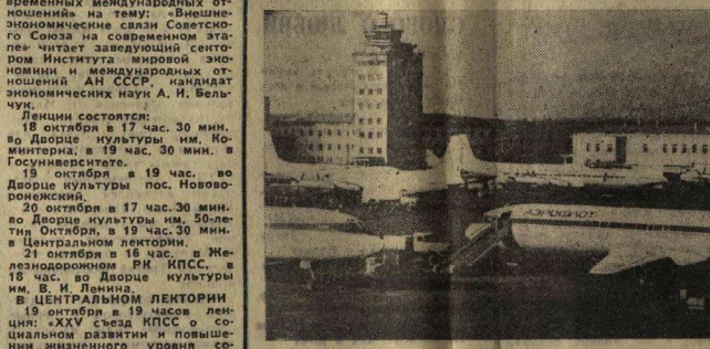
НА СНИМКЕ: В АЭРОПОРТУ «ВНУКОВО».