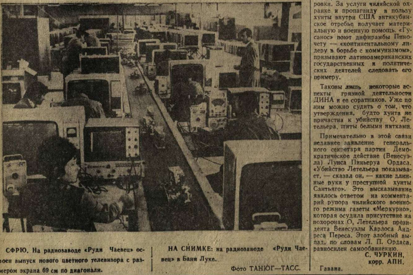
СФЮ. На радиозаводе «Руда Чаяева» освоев выпуск нового цветного телевизора с размером экрана 69 см по диагонали.