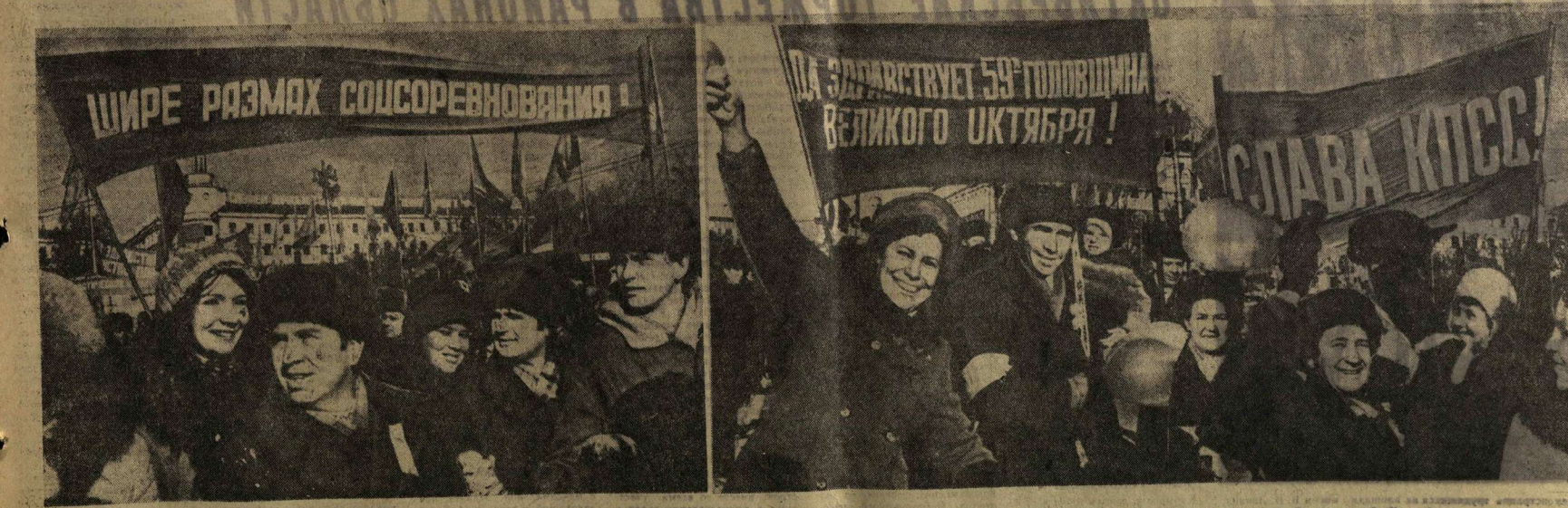
Демонстрация трудящихся г. Воронежа на площади имени В. И. Ленина.

Товарищи члены Советских Военно-воздушных сил! Трудящиеся Советского Союза! Наши уважаемые зарубежные гости! От имени и по поручению Центрального Комитета Коммунистической партии Советского Союза и Советского правительства приветствую и поздравляю вас с 59-й годовщиной Великой Октябрьской социалистической революции. Великий Октябрь — поворотный пункт в истории нашей страны. Он открыл новую эпоху в истории человечества — эпоху перехода от капитализма к социализму. Под знаменем коммунизма мы вступили в историю.