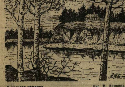
У лесного кордона. Рис. В. Анкина.

Над зеленым разлодом кое-где торчат оборванные остатки леса, — пряные как штык жердики без единого шуха. А другие с кое-какими рогульками. Слово бы договорились эти жалкие существования меж собой: «Давайте похозяйству на просторе, пока подрастает зеленые мадаши, наша смеана. И на одной из таких жердин с парой отростков сидят-скачут три горлянки. Молчат-молчат, поворачивают