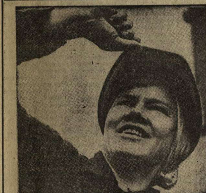
М ЕТЕТ ВЕТЕР по площадке холодный золотой лист, гуляет по этажам новостройки...