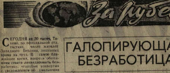
Учитывая общую обстановку на рынке труда, это заявление мало кто принимает всерьез.

Сельский специалист должен обладать широкими знаниями и умениями. Он должен быть способен решать различные задачи, связанные с производством и обслуживанием сельскохозяйственной техники. Важно также иметь хорошую физическую подготовку и умение работать в коллективе.