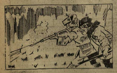
Ю. БЕСПАЛЕНКО, специальный корреспонент «Коммуны», Бобровский район.

дуются самостоятельно в асу, как им заблагорассудится.